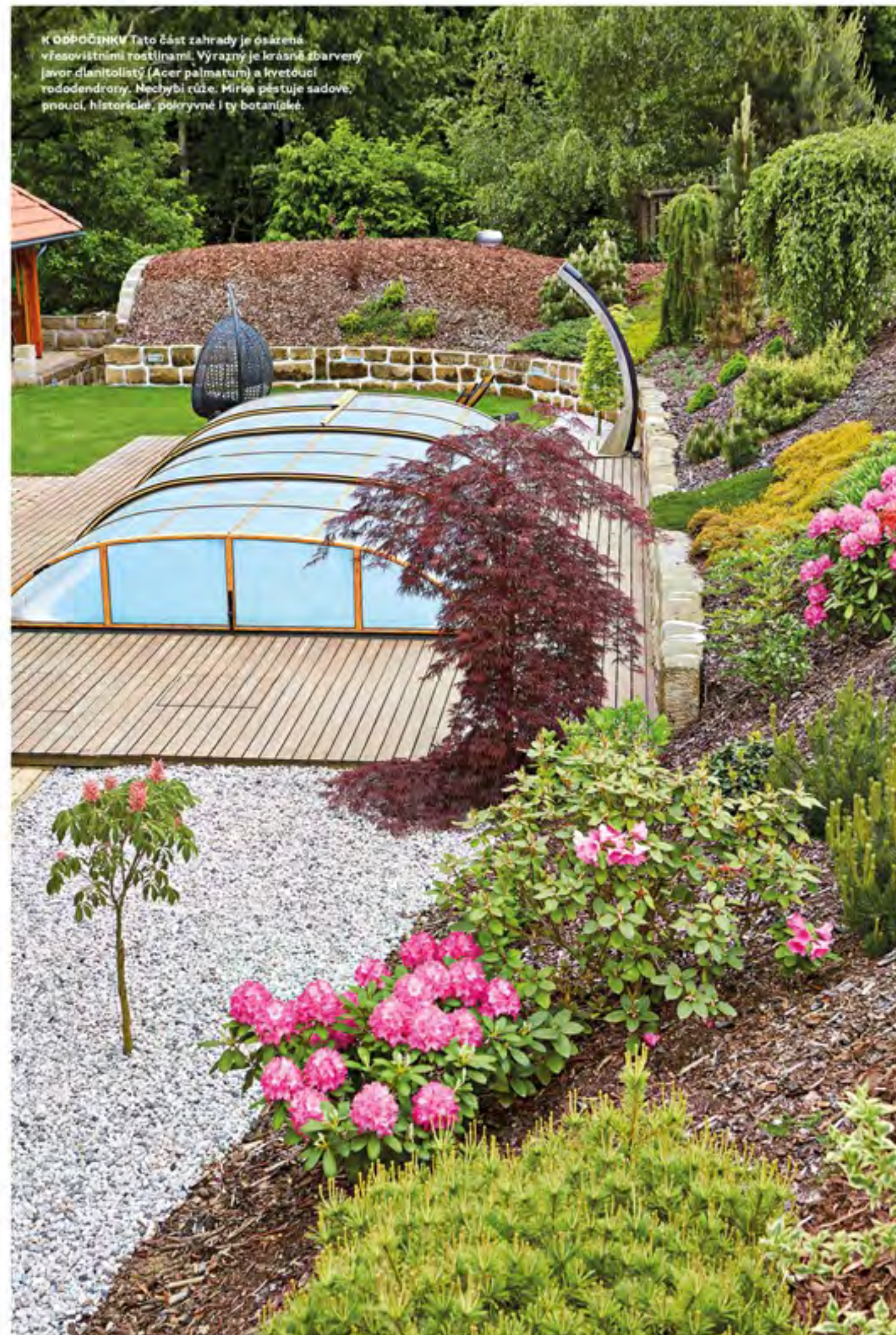
K ODPOROČNÍKV Tato část zahrady je osázená vřesovištními rostlinami. Výrazný je krásně zbarvený javor dlanitolistý (Acer palmatum) a kvetoucí rododendrony. Nechybí růže. Mirka pěstuje sadové, proucí, historické, pokrývné i ty botanické.