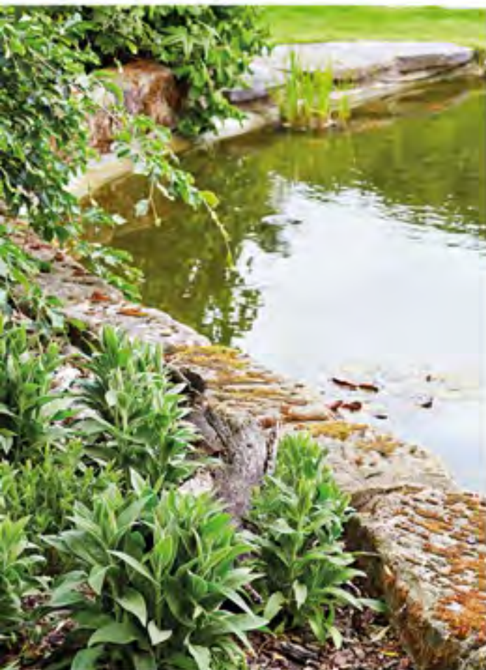
BŘEHY Placáky kolem jezírka z pískovce přivezli manželé z blízkého lomu. Kolem něj vysadili vlhkomilné rostliny, do vody lekníny, vodní kosatce a také orobínce.

chemii používejte pouze výjimečně. Pokud chcete, aby růže opakovaly kvetení – remontovaly, je třeba odstříhávat odkvetlá květenství hned za druhým lístkem, budou vám kvést do zámrazu. Okrasné dřeviny tu netvarují, ale v době vegetačního klidu provádějí udržovací řezy. „Ideální je únor, březen, kdy je teplota do 5 °C, v zimě se také nejlíp řezy trénují,“ říká Mirka. „Zdravotní a bezpečnostní řezy stromů se ale provádějí hned.“